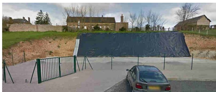
Lieu d'implantation de la future « Base Nature » et de la salle communale