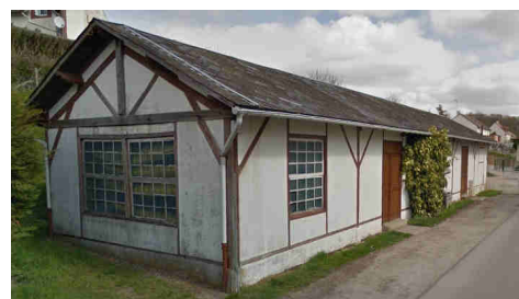
Ancienne imprimerie BOHIN

La commune souhaite donc créer un nouveau bâtiment qui puisse accueillir la base « Sport-Nature ».