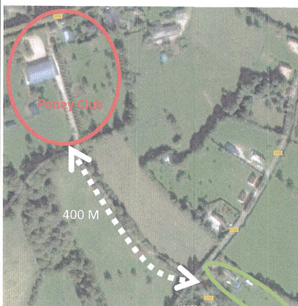
Futurs gîte et aire naturelle de camping

La société diversifie son champ d'intervention et crée ainsi une nouvelle source de revenu.