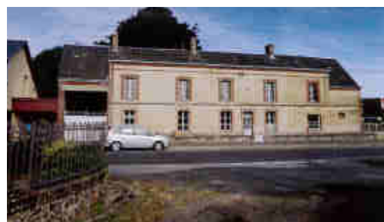
Façade principale du bâtiment actuel à détruire Vue depuis la RD 918